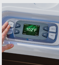
Panneau de commande LCD couleur