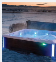
Isolation haute densité FiberCor®