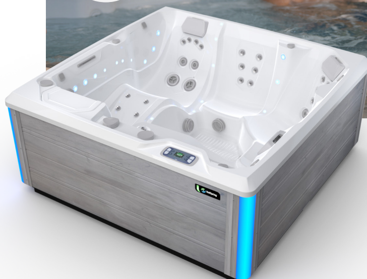
Avec coque Blanc alpin et habillage Gris côtier